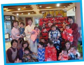
玄関の飾りは春をイメージした 飾り付けがしてあります。